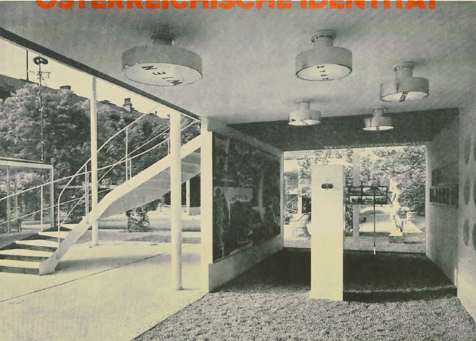
Architekt Ernst Lichtblau, Fremdenverkehrs-Pavillon, Pavillon de renseignements pour voyageurs, Traffic Pavillon, in: Soma Morgenstern, „Die Ausstellung des österreichischen Werkbundes“, Die Form , Nr. 5, 1930, S. 331.